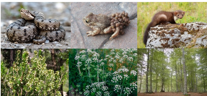
D'esquerra a dreta i de dalt a baix: escurçó, tòtil, fagina, bruc d'escombres, pimpinella i faig