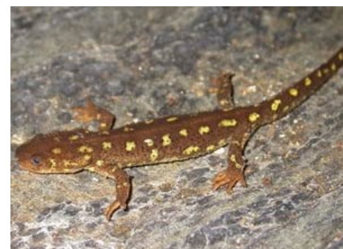
El tritó del Montseny ( Calotriton arnoldi ) és una espècie d'amfibi endèmic de Catalunya. Es troba en perill d'extinció, amb una estimació de només 1500 individus