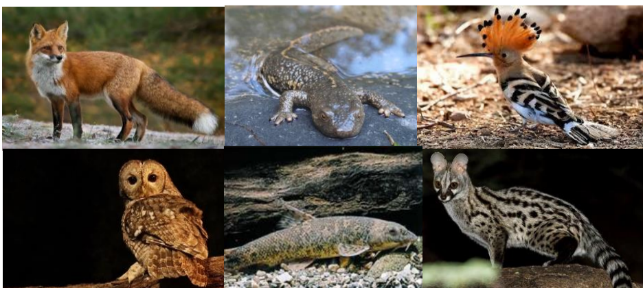
D'esquerra a dreta i de dalt a baix: guineu, tritó pirinenc, puput, gamarús, barb de muntanya i geneta.