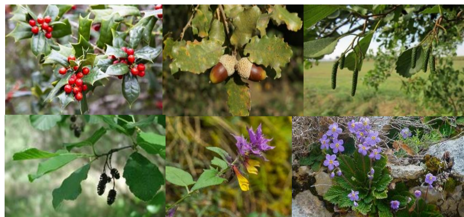
D'esquerra a dreta i de dalt a baix: boix grèvol, roure, faig, vern, melampyrum nemorosum i orella d'os.