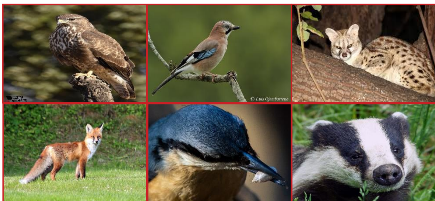
D'esquerra a dreta i de dalt a baix: aligot, gaig, geneta, guineu, pica-soques blau i teixó.