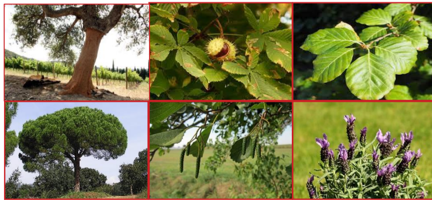
D'esquerra a dreta i de dalt a baix: alzina surera, castanyer, faig, pi pinyer, vern i cap d'ase.